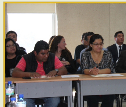
Integrantes del Consejo Consultivo integran la Comisión para la Revisión, junto con docentes universitarios.